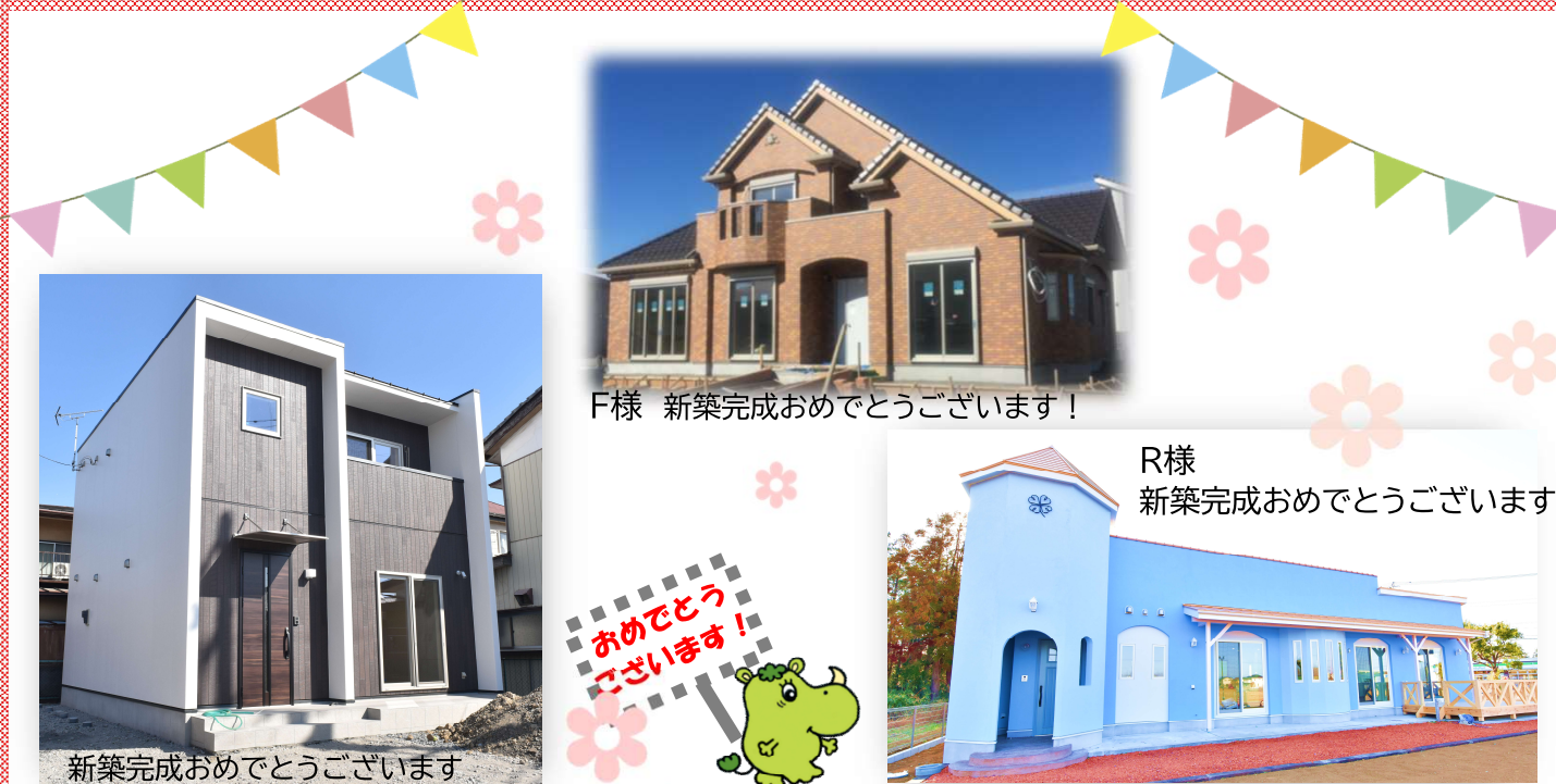
F様 新築完成おめでとうございます！